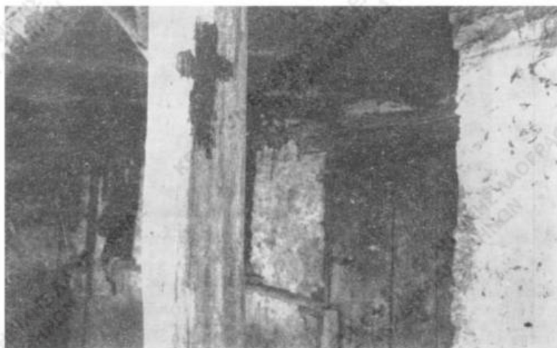
Εἰκ. 1. Ὁ σταυρὸς εἰς τὴν παραστάδα τῆς ἐξωθύρας.

Ἡ συνήθεια εἶτα τοῦ διὰ τοῦ φωτὸς τοῦ κηρίου τῆς Ἀναστάσεως καυαλί- σματος τοῦ ἄκρου τῆς οὐρᾶς ἐκάστου καματεροῦ ζώου 1 ὡς ἐπίσης καὶ τῆς κατα- σκευῆς σταυροῦ ἐπὶ τῆς θύρας διὰ τῆς φλογὸς αὐτοῦ ἢ μὲ κατράνι (βλ. εἰκ. 1) γί- νονται «για νὰ μὴ μπαίνουν τὰ κακὰ δαιμόνια καὶ για νὰ προφυλάσσονται τὰ ζῶα μας ἀπὸ τίς ἀρρώστειες» (χφον, σ. 35). Τὸ ἔθιμον τοῦτο τῶν σταυρῶν εἰς τὴν