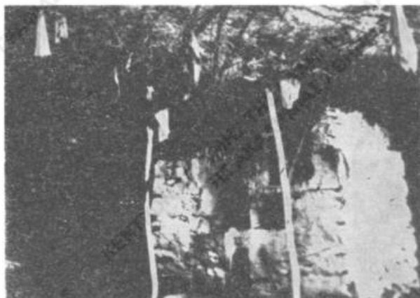
Εἰκ. 2. Ἡ πηγὴ, ἀγίασμα, εἰς τὸ χωριὸν Ἄνω Κλειναί.

κομίζεται εις τὴν ἐκκλησίαν διὰ τὸν Ἅγ. Σπυρίδωνα, τὸ ὁποῖον, ἀφοῦ εὐλογηθῆ κατὰ τὴν θεϊαν λειτουργίαν, δίδεται νὰ τὸ φάγουν τὰ ζῶα (χφον, σ. 212). Εἰς τὸν Ἅγιον Μηνᾶν κατέφευγον παλαιότερον, δηλ. πρὸ τοῦ 1940, διὰ τὴν ἀνεύρεσιν ἀπολεσθέντος ζῴου, κομίζοντες εἰς τὴν ἐκκλησίαν ἔριον ὡς ἀφιέρωμα εἰς αὐτὸν