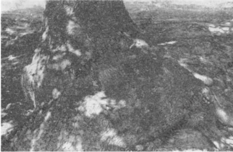
Εἰκ. 3. Ἡ ὀπή εἰς τὸν κορμὸν δένδρου ἀπὸ ὅπου ἐξέρχεται τὸ στοιχειό. (Ἄνω Κλειναί).

Πιστεύεται ὅτι τὸ Ψυχοσάββατον τῆς Πεντηκοστῆς αἱ ψυχαὶ τῶν νεκρῶν περιφερόμεναι ἐπὶ τῆς γῆς ἀπὸ τῆς Μεγ. Παρασκευῆς ἐπιστρέφουν εἰς τοὺς τάφους. «Τότε (δηλ. τὸ ἑσπέρας τῆς παραμονῆς) πηγαίνομεν κόλλυβα εἰς τὴν ἐκκλη-