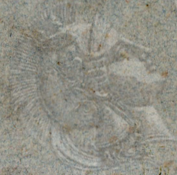
EXHIBIT NO. 1 TIA & ALPHEO 1836