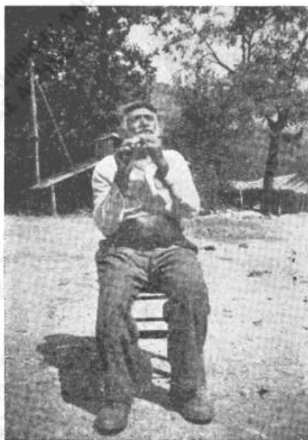
Εἰκ. 2. Παίκτης τοῦ ὄργάνου νάϊ.

ξιὰ καὶ ἀριστερά, κυκλικῶς κινουμένων τῶν χορευτῶν, ἀλλὰ σχεδὸν εἰς τὴν αὐτὴν θέσιν. Οἱ χορευταὶ κρατοῦνται ἰσχυρῶς ἀπὸ τοὺς ἀγκῶνας των καὶ κινοῦνται ὁμαδικῶς καὶ μὲ συμμετρίαν πρὸς τὰ ἔσω καὶ ἔξω τοῦ ἡμικυκλίου, ἐλάχιστα δὲ πρὸς τὰ δεξιὰ.