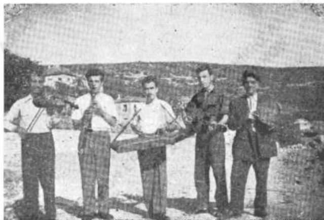
Εἰκ. 1. Ὁργανοπαίχται μετὰ τὰ ὄργανα: βιολί, κλαρίνο, σαντούρι, κιθάρα καὶ ντέφι.

της είναι ὁ κλειστός ἢ καλούμενος στό. Τὸ ὄνομα τοῦτο ἔλαβεν ἕως ἐκ τοῦ ὅτι