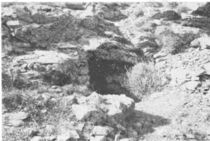
Εἰκ. 3. Ἡ σπηλιά τοῦ Κύκλωπα.

πον ἀλώσεως αὐτοῦ, συμβουλεύσασα αὐτοὺς νὰ ἀποκόψουν τοὺς σωλῆνας, δι' ὧν ὑδρεύετο τὸ κάστρον, ἵνα ἐξαναγκασθοῦν εἰς παράδοσιν οἱ ἐντὸς αὐτοῦ ἐγκεκλεισμένοι, ὅπερ καὶ ἐγένετο. Πρὸς τὴν παράδοσιν ταύτην συνάπτονται ἀναποσπάστως οἱ ἀρχικοὶ μόνον στίχοι δημῶδους ἄσματος, ὅπερ ἀποτελεῖ παραλλαγὴν τοῦ ἄσματος τοῦ κάστρου τῆς Ὁριᾶς (χειρ., σ. 7 καὶ 35)¹.