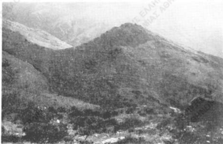
Εἰκ. 1. Τὸ κάστρον τῆς Γριᾶς.

Ἐκ τῆς συλλεχθείσης ταύτης ὕλης 2 σημειωτέα ἰδιαιτέρως αἱ τοπικαὶ παραδόσεις, αἵτινες παρουσιάζονται ἐνδιαφέρουσαι. Μία αὐτῶν ἀναφέρεται εἰς τὸ καλούμενον κάστρον τῆς Γριᾶς (εἰκ. 1 καὶ 2). Τοῦτο ὀφείλει τὴν ὀνομασίαν του εἰς τὸ γεγονός ὅτι γραῖα ὑπέδειξεν εἰς τοὺς πολιορκοῦντας αὐτὸ πειρατὰς τὸν τρό-