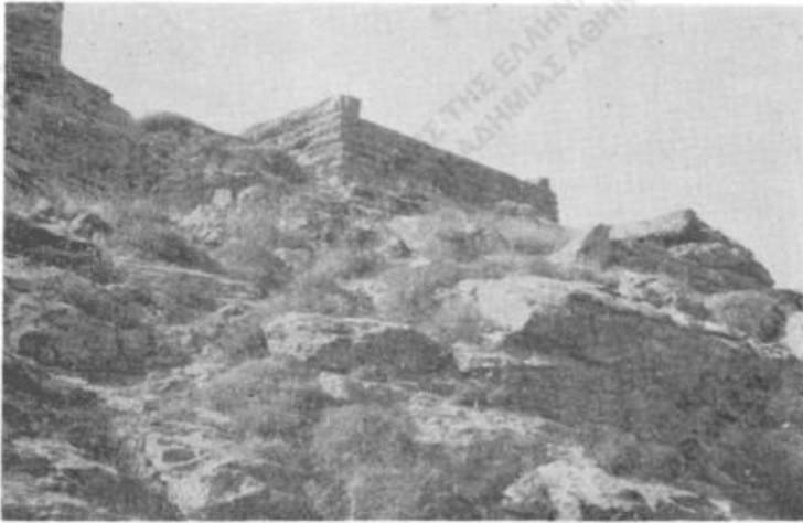
Εἰκ. 4. Ὁ Ψαροῦ πύργος.

σέως καὶ τοῦ Πολυφήμου (χειρ., σελ. 10, 34-35). Τὸ σπήλαιον ὅμως τοῦτο ἀνεκαλύφθη μόλις τῷ 1893 κατὰ τὰς εἰς τὴν περιοχὴν ταύτην ἐκσκαφὰς πρὸς ἐξόρυξιν σιδηρομεταλλεύματος 1 . Προφανῶς ἡμιλόγιός τις γνωρίζων τὸν μῦθον ἐκ τῆς διδασκαλίας ἐν τῷ σχολείῳ ἢ ἄλλως προσήρμωσεν αὐτὸν ἐνταῦθα, εἰς τοῦτο δ' ὑπεβοήθησαν ἴσως ἡ θέσις τοῦ σπηλαίου ὑπὲρ τὴν θάλασσαν, ἢ ὑπαρξίς