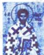
Εικ. 12. Άγιος Ελευθέριος (Αθήνα - Γκούζη)