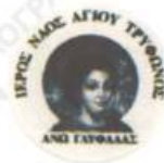
Εικ. 39. Άγιος Τρύφων (Γλαφίδα)