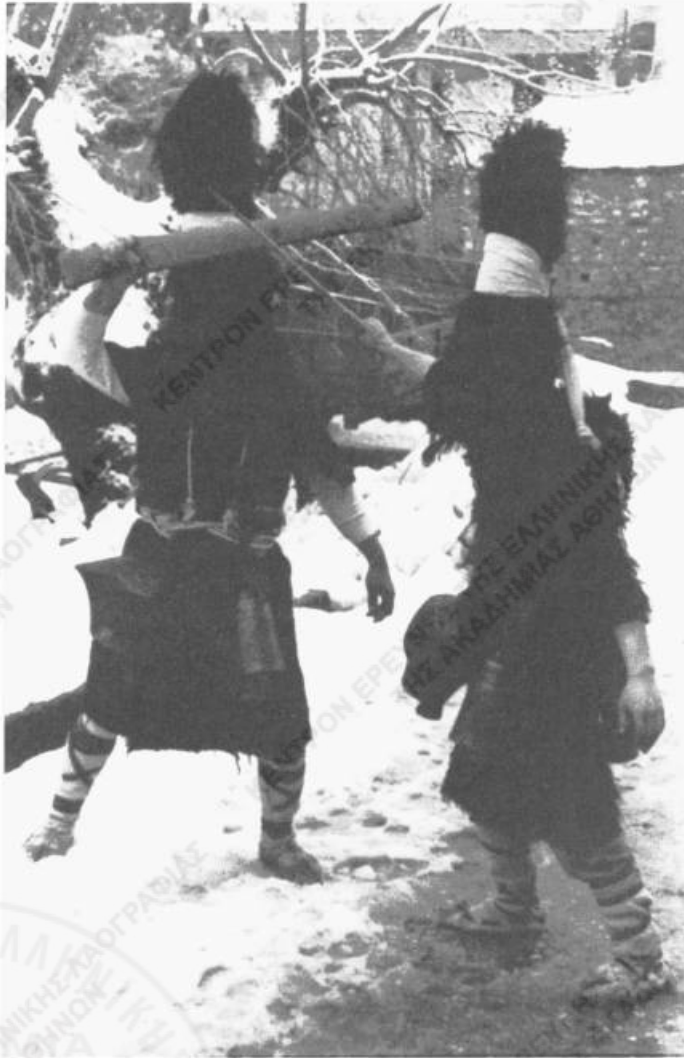
Εικ. 1. «Αράπηδες», μεταμφιεσμένοι του Δωδεκαημέρου στη Νικήσιανη Καβάλας.