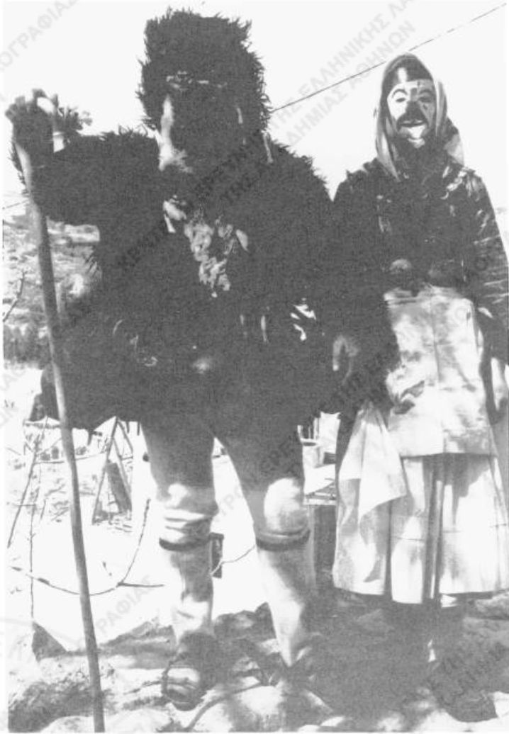
Εικ. 2. «Γέρος» και «Κορέλα» της Σκύρου (φωτ. Γ.Ν. Αικατ., 1978).