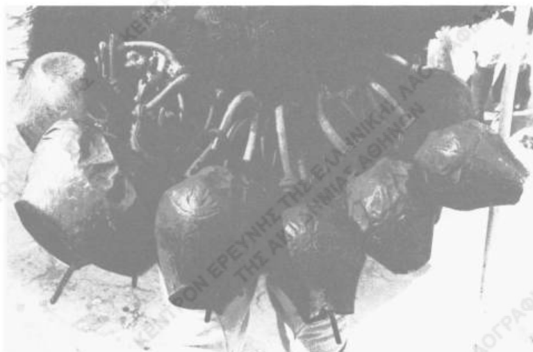
Εικ. 4. Τα κουνδούνια ενός «Γέρον» της Σκύρου.