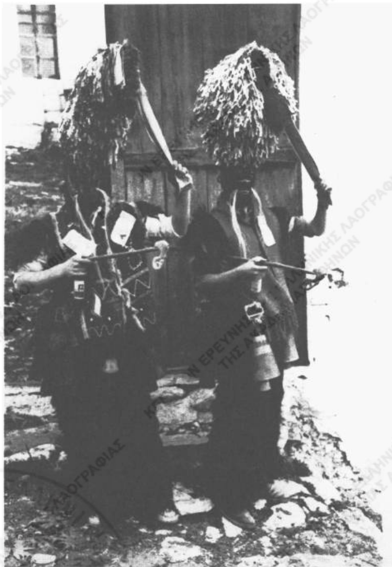
Εικ. 3. «Καρναβάλια» του Σοχού Θεσσαλονίκης (φωτ. Γ.Ν. Αικατ., 1978).