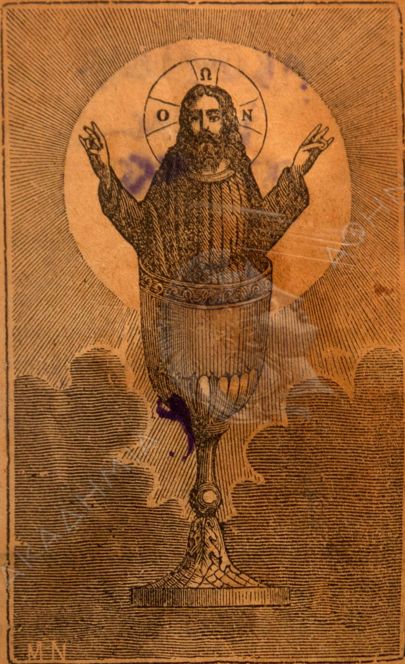
Η ΘΕΙΑ ΜΕΤΑΛΗΨΙΣ