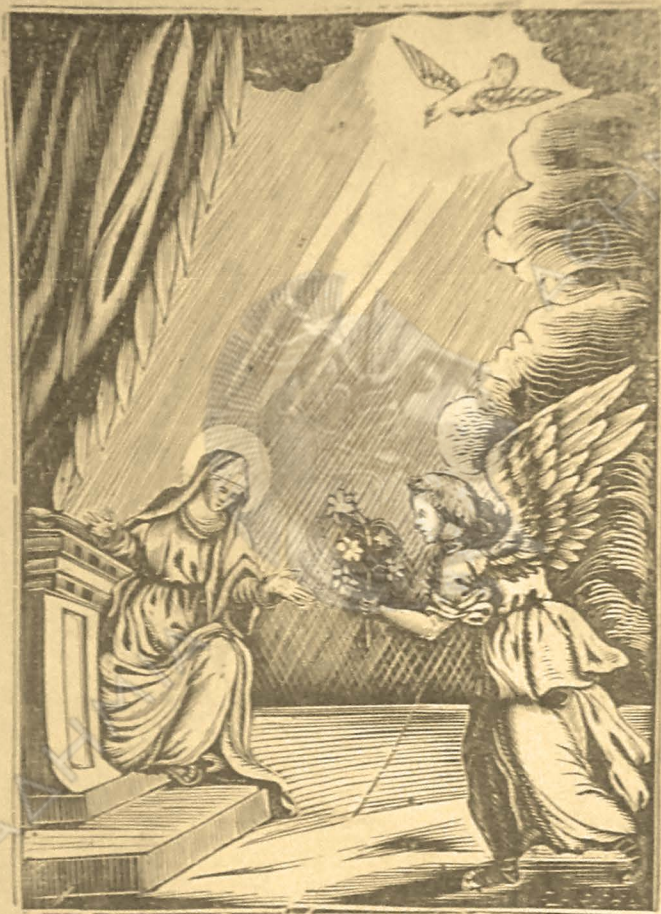
Παναγίας ης Μουζδελερμεσι