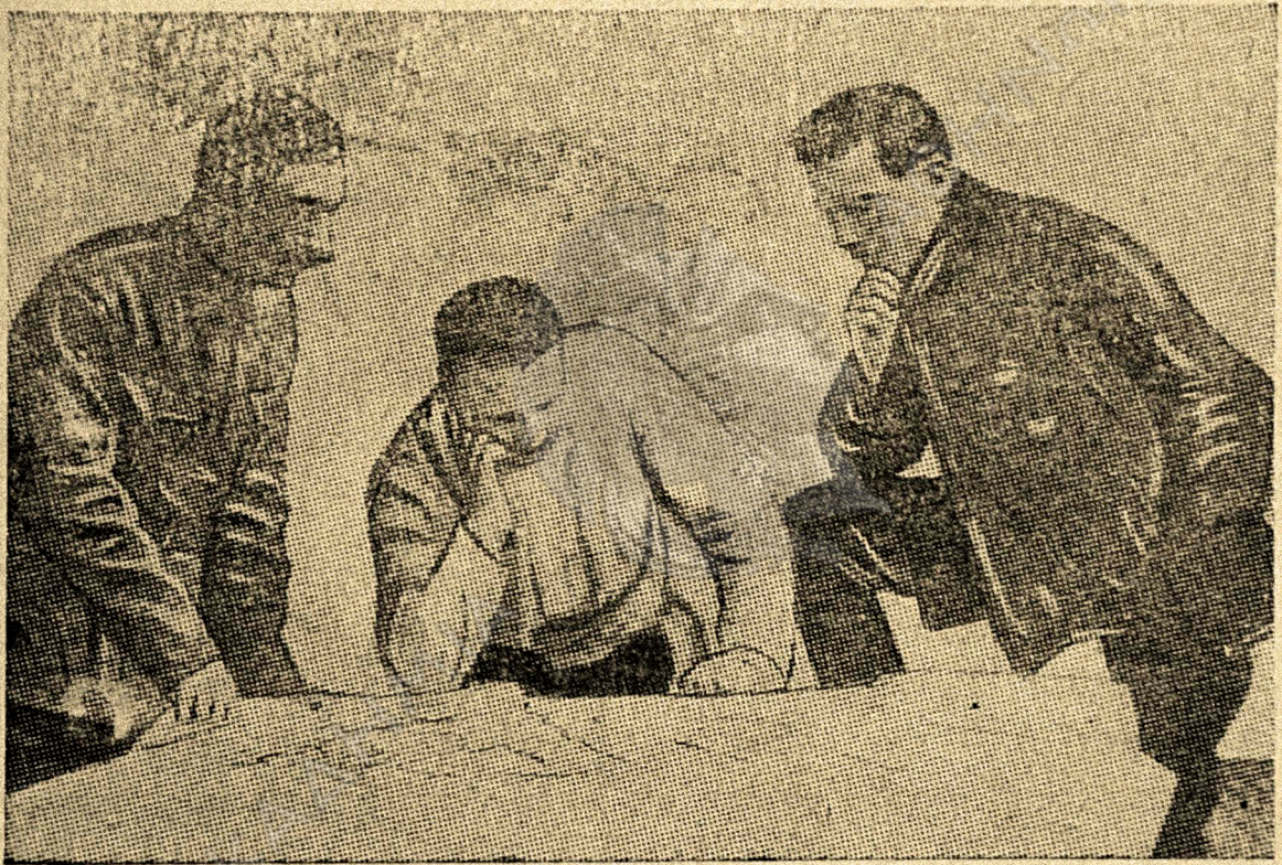
Ο Μπουτιόνι, ο Μ. Φρόνζε, κε ο Βοροσσίλοβ σο πολωνικον τον μέτοπον.

Απαν σιν Υκρανίαν κε σο Τονπας επλόθεν σατο τον κερον ο κίνδινον τι γερμανικου τιμπεριαλιζμου. Τυκρανικον ι πυρξζυαζία εντάμαν με τι μενσσεδικς κε τι εσέρυς επίκαν σινφονίας με τι γερμανυς τι γενεράλυς κε τι καπιταλίστας. Σο γερμανικον τιν κιδέρνισιν, εδόχτεν το δικέομαν να κυβαλι ασιν Υκρανίαν όλια ότι εχριάσκυτον ο γερμανικον ο στρατον. Σατο αντίκρι ο γερμανικον