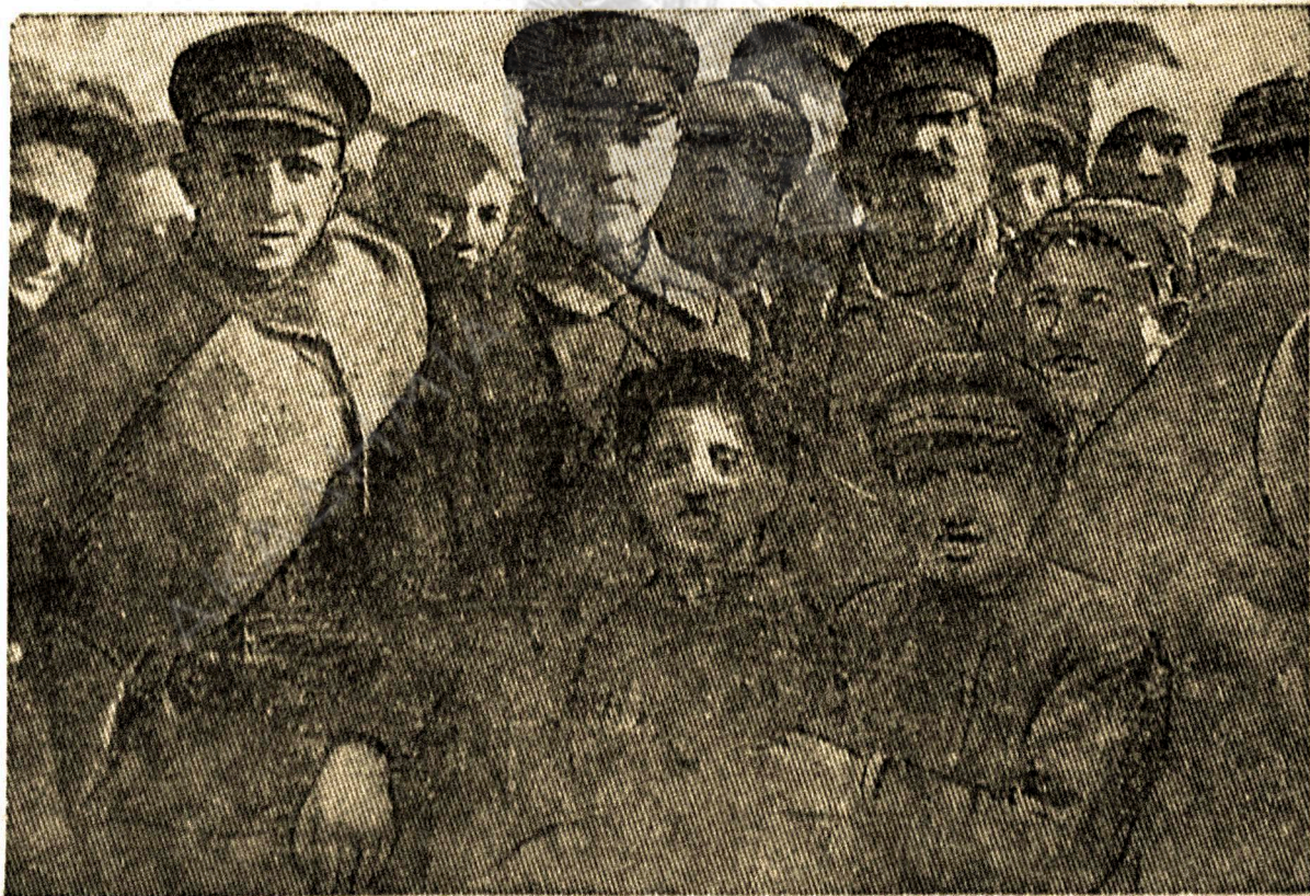
Ο ζιν. Βοροσσίλοβ ανάμεσα ει πολεμιστάδας

«Τεμέτερον ο Κλιμ" έλεγαν για τατον ι πολεμιστε τι Στρατου τι Καβαλέριας. Το μαχιτικον ι ζοι ένοσεν δινατα τον ζίντροφον Βο- ροσσίλοβ με τιν μάζαν τι πολεμιστάδον τι Στρατου τι Καβαλέριας.