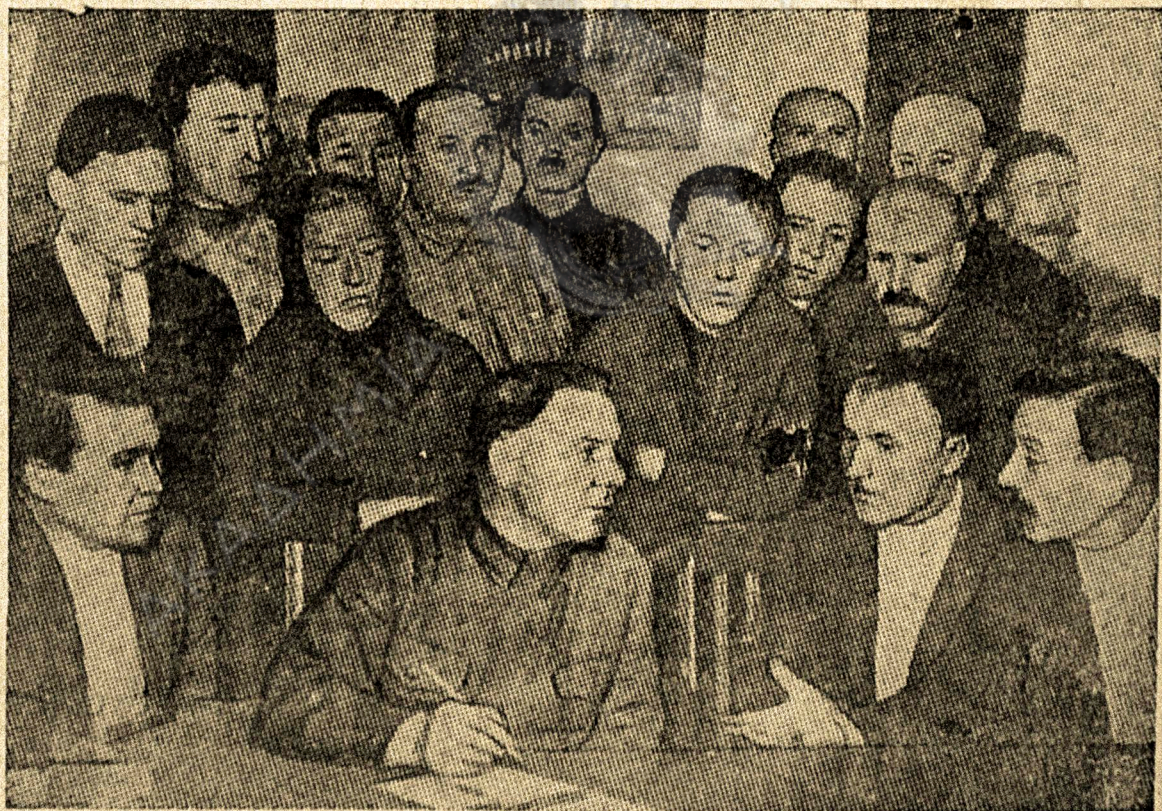
Ο. ζ. Βοροσίλοβ ομιλα με τ' εργάτας τι Δυγάνζικι.

Ι χορετ εθέλναν να επέρναν ασι παμέζσικυς τα χόματα, αλα εφούσαν τι καζακς τίναν ενικίασαν ι πομέζσικι για να φιλάτνε τα χτίματατυν.