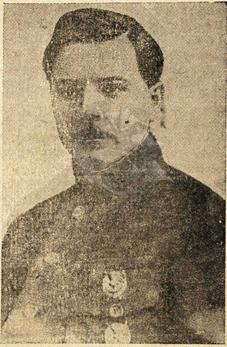
Κ. Ε. ΒΟΡΟΣΣΙΛΟΒ

απάν στα βασικά τα ζητήματα τι πολιτικis τι κόματος. Ιστερα ασον θάνατον τι Λένιν ο Τρότσκι εδιοργάνοσεν τατινυ γρύπαν κε επίκεν αγόναν ενάντια ρον Λενινιζμον. Στο ριμερνον τον κερων ι τροτσκιστ τελιοτικα εγένταν αντεπαναστάτε, τυςσμαν τι ροβετικυ τεκσυσίας.